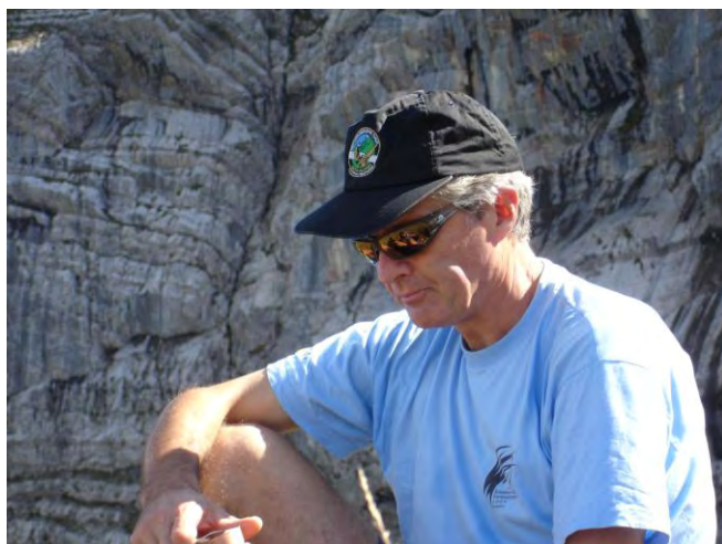
Turnfahrt Säntis 20.9.2006