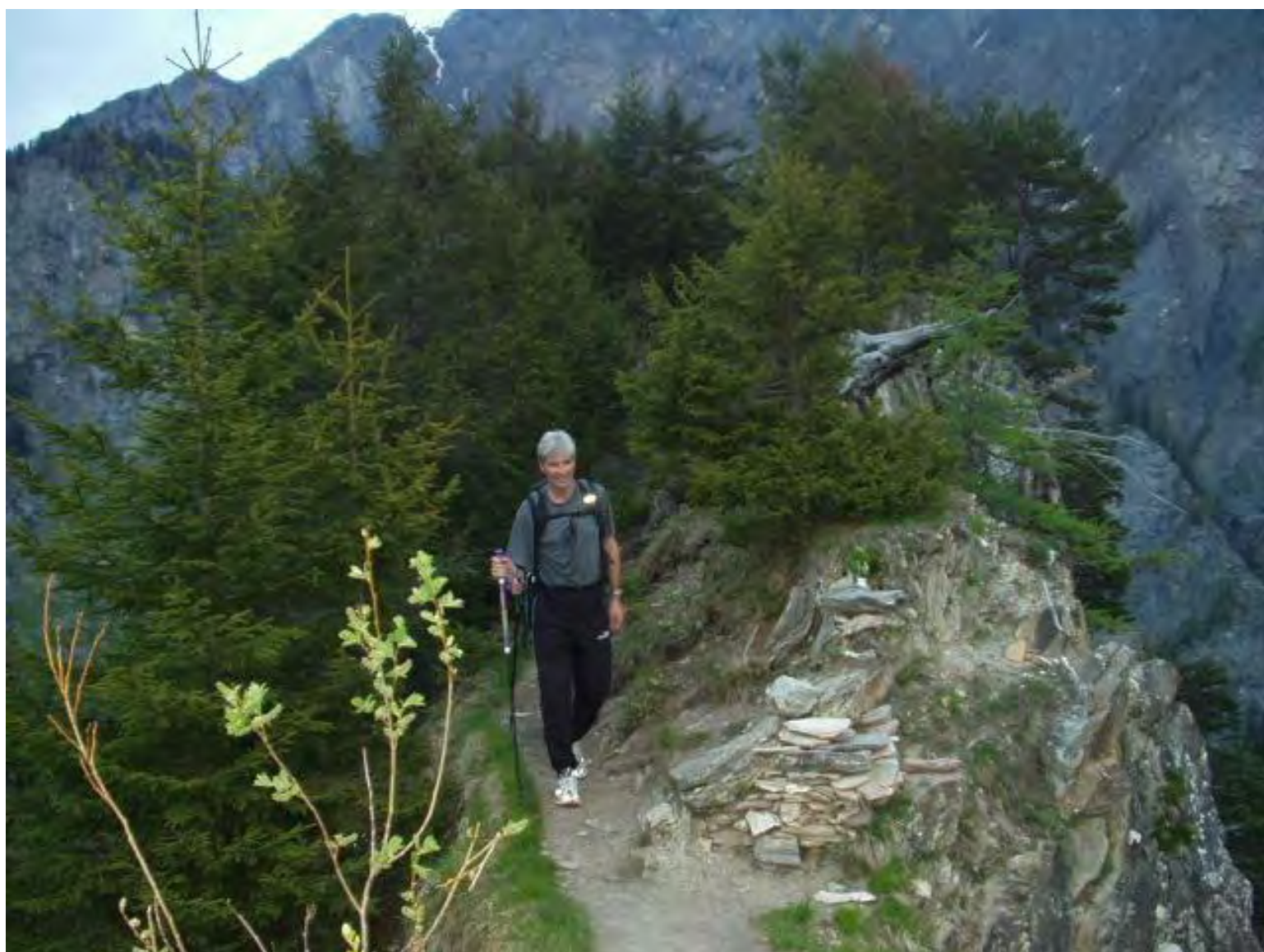
Am 26.5.2004 mit dem TVT auf der Roten Platte