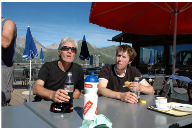
Turnfahrt Schmelzboden – Monstein 9.8.2008